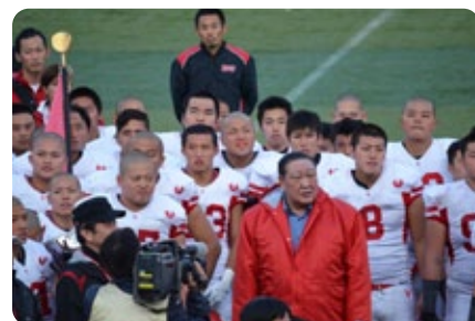
喜びの理事長と選手